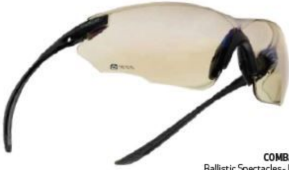
COMBAT Ballistic Spectacles - Kit

قامت "Bolle" التي تُعرف بتصميم النظارات الواقية للشمس، والرياضة، ومختلف الصناعات، بتطوير مجموعة من المنتجات البصرية العسكرية حيث تُطابق هذه المجموعة أعلى المعايير من حيث مقاومة الشظايا الناتجة عن التفجيرات وإطلاق الرصاص، وتصفية الغبار، والأشعة فوق البنفسجية، وأشعة الليزر، والجودة البصرية. تم تصميم كافة المنتجات واختبارها والمصادقة عليها لتقدم الحل الأكثر فعالية وفقاً لكل حالة وبيئة، مكافحة الإرهاب والعمليات الخاصة والصراعات المسلحة.