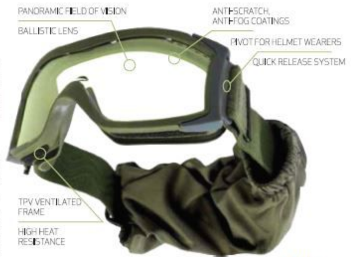
X 1000 Ballistic Goggle