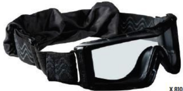
X 810 Ballistic Goggle