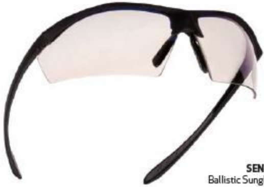
SENTINEL Ballistic Sunglasses

وقد صممت جميع المنتجات التكتيكية واختبرت وفقاً للمعيار STANAG 2920 الخاص بالناثو، حيث يتم تعريض العدسات لتأثيرات مكافئة لقوة رصاص عيار 0.22" التي يمكن أن تصل سرعته إلى 275 م/ث، 990 كم/ساعة. لتقديم الحل الأكثر فعالية لجميع الحالات والظروف الخطرة مثل مكافحة الإرهاب والعمليات الخاصة والصراعات المسلحة.