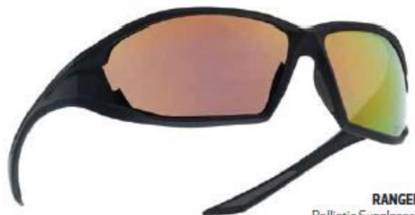
RANGER Ballistic Sunglasses