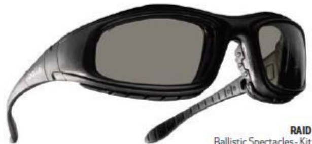
RAID Ballistic Spectacles - Kit